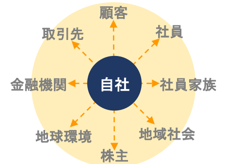
ステークホルダーとの信頼関係

人間性 (倫理観) 人間尊重の幸せフィロソフィー 科学性 (価値観) 技術革新による新たな価値の追求 社会性 (使命感) 自利利他の誠実な社会的責任活動